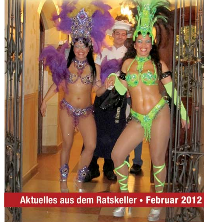
Aktuelles aus dem Ratskeller • Februar 2012