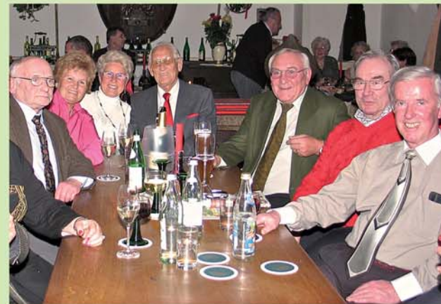
Einer der vielen gemütlichen Stammtische im Ratskeller: „Die gachgwadelten Gniabisler aus Hinterdupfing“

... ihn gibt es wohl schon seit Jahrtausenden. Und egal, welche Kultur, welche Hautfarbe, welche Religion - ein Stammtisch ist scheinbar schon was verflixt gemütliches! Sonst würden die Stammtischbrüder- und Schwestern nicht immer wieder in regelmäßigen oder unregelmäßigen Abständen zusammenkommen und sich das Erlebte der vergangenen Wochen erzählen. Meist wird viel gelacht, oft wird bedauert, gerne wird gelästert und getratscht, manchmal auch getrauert. Aber, man freut sich auf den nächsten Stammtisch. Man kommt raus von zuhaus'. Viele